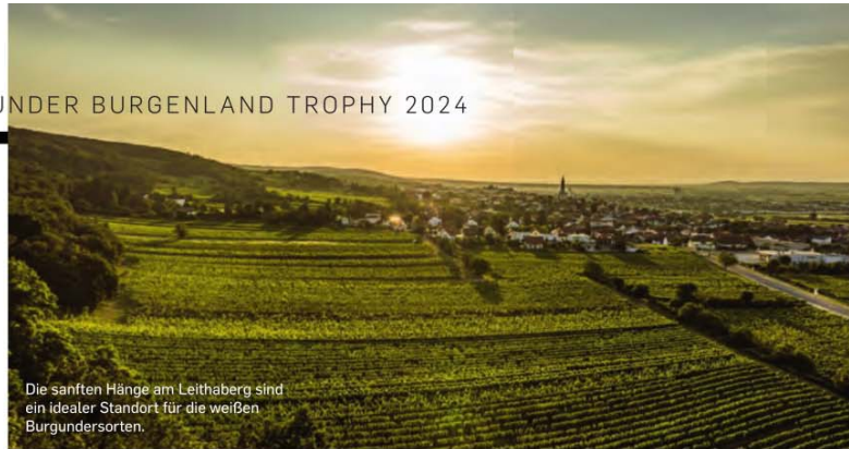
Die sanften Hänge am Leithaberg sind ein idealer Standort für die weißen Burgundersorten.

● Chardonnay Uferlos 2023 Schaller vom See, Podersdorf am See Helles Grüngelb, silberfarbene Reflexe. Feine, einladende Tropenfrucht, zart nach Papaya und Mango, ein Hauch von Blütenhonig. Limettenzesten sind unterlegt. Saftig, stoffig, weißer Apfel, gute Komplexität, dabei leichtfüßig und mineralisch, bleibt haften, ein finessenreicher Speisenwein. schallervomsee.at, € 9,50