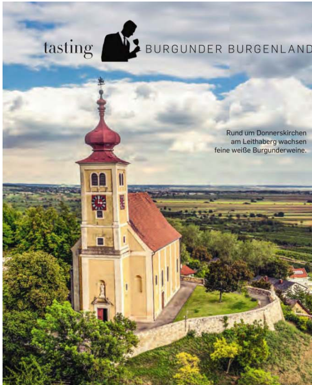
Rund um Donnerskirchen am Leithaberg wachsen feine weiße Burgunderweine.